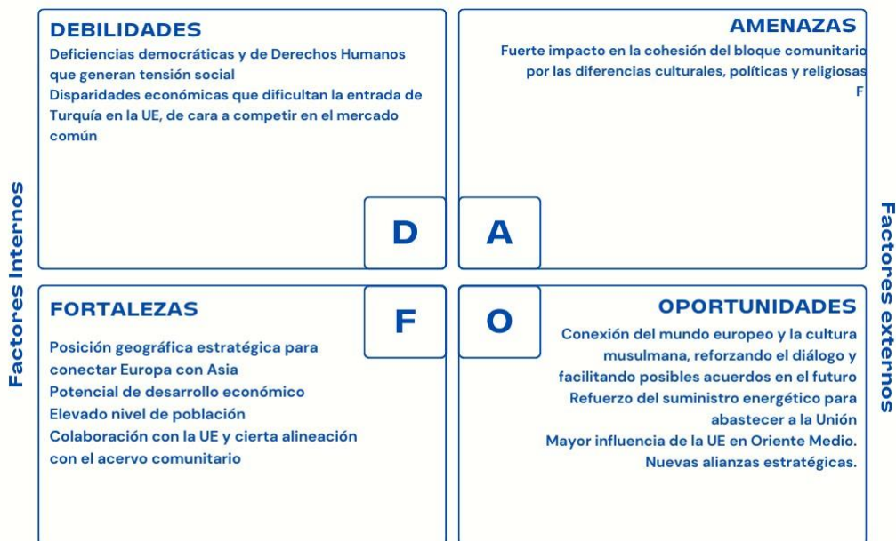
Anexo 10. DAFO Turquía.