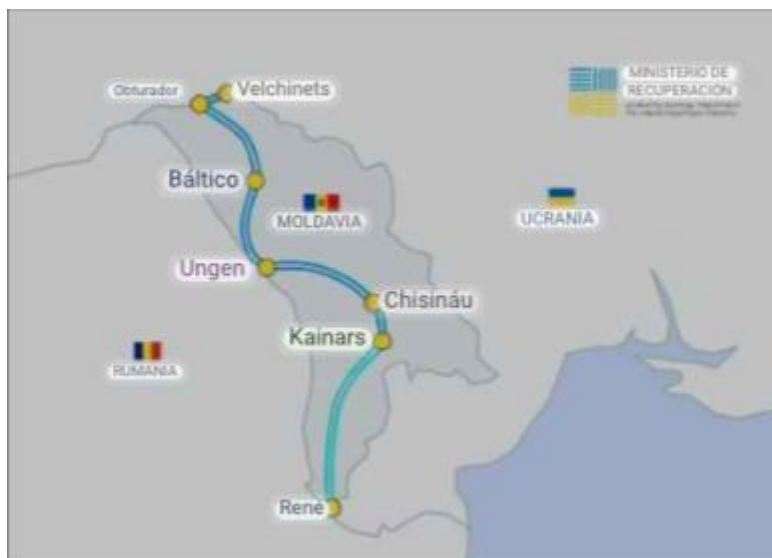
Anexo 11. Presencia rusa en el entorno de Moldavia.